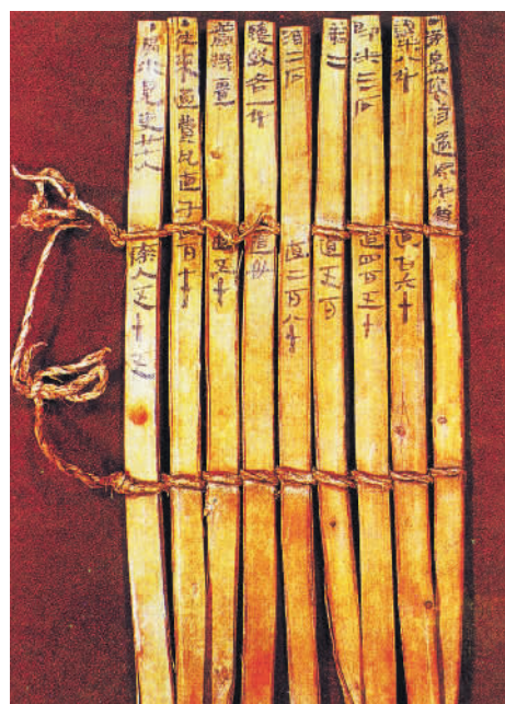
20世纪中国档案学四大发现之一的居延木简(额济纳河流域出土)。

“每每抚读这些尺牍帛书,2000多年后的我们依然能够真切地感受到一个个活生生的人及其日常生活片段,字里行间都能体会