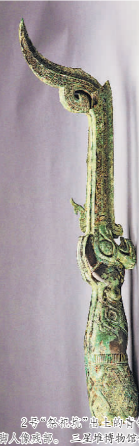
2号“祭祀坑”出土的青铜鸟脚人像残部。