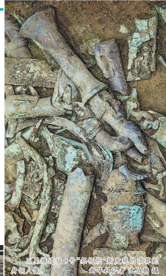
三星堆遗址8号“祭祀坑”新发现的顶尊蛇身铜人像。