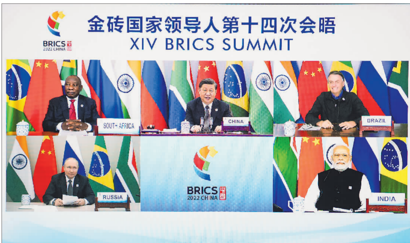
6月23日晚，国家主席习近平在北京以视频方式主持金砖国家领导人第十四次会晤并发表题为《构建高质量伙伴关系 开启金砖合作新征程》的重要讲话。南非总统拉马福萨、巴西总统博索纳罗、俄罗斯总统普京、印度总理莫迪出席。

新华社北京6月23日电（记者杨依军）国家主席习近平23日晚在北京以视频方式主持金砖国家领导人第十四次会晤。南非总统拉马福萨、巴西总统博索纳罗、俄罗斯总统普京、印度总理莫迪出席。 人民大会堂东大厅花团锦簇，金砖五国国旗整齐排列，与金砖标识交相辉映。 晚8时许，金砖五国领导人集体“云合影”，会晤开始。 习近平首先致欢迎辞。习近平指出，回首过去一年，面对严峻复杂的形