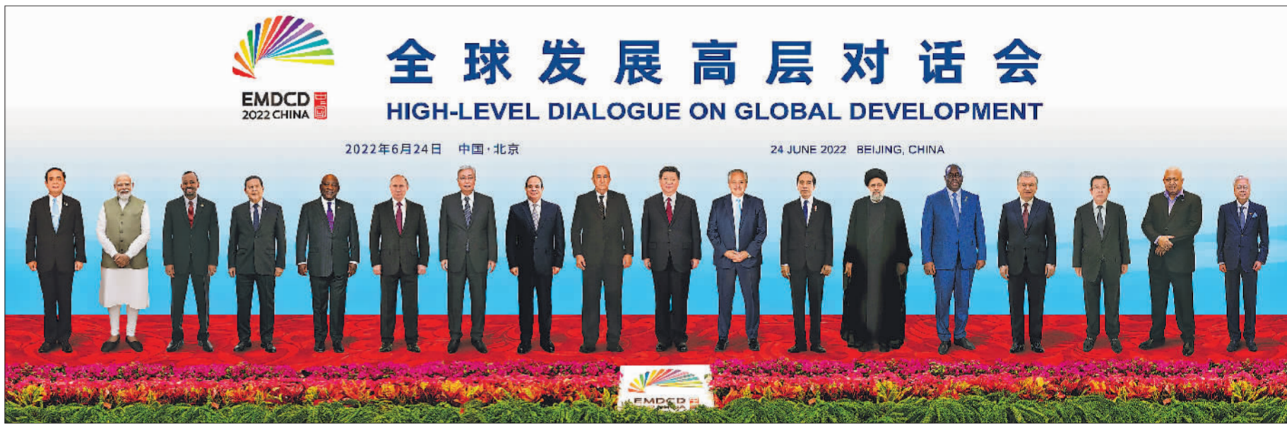
6月24日晚，国家主席习近平在北京以视频方式主持全球发展高层对话会并发表题为《构建高质量伙伴关系 共创全球发展新时代》的重要讲话。这是与会各国领导人的“云合影”。