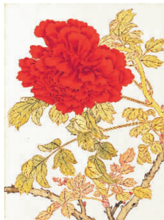
《牡丹》 钱维城(清)