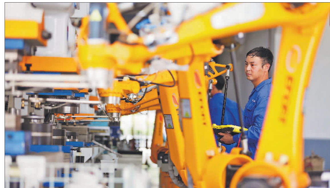
“智慧”发展提效率 7月6日,在浙江省德清县浙江南泵流体机械有限公司生产车间内,技术人员正在调试四轴机器人设备。近年来,该公司大力引进智能设备,生产效率成倍提升。