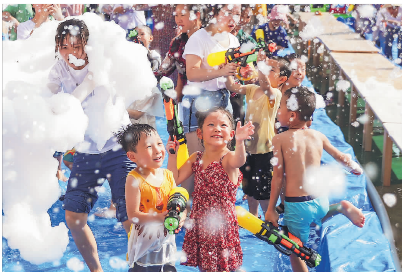
清凉“夏” 7月5日,四川省华蓥市杜家坪幼儿园的小朋友与家长在泡沫中开心玩耍,享受清凉。