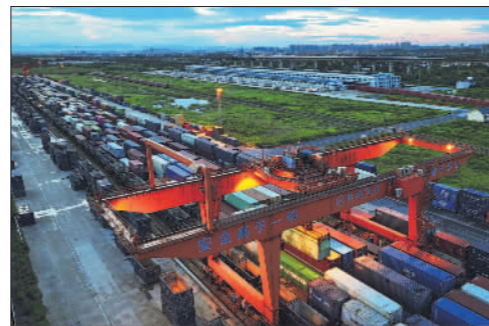
国际陆港服务“一带一路”

7月7日,河北省秦皇岛市海港区开展免费家政技能培训活动,开设整理收纳、母婴护理、养老护理等多个专业的培训班,提高当地妇女的就业能力。