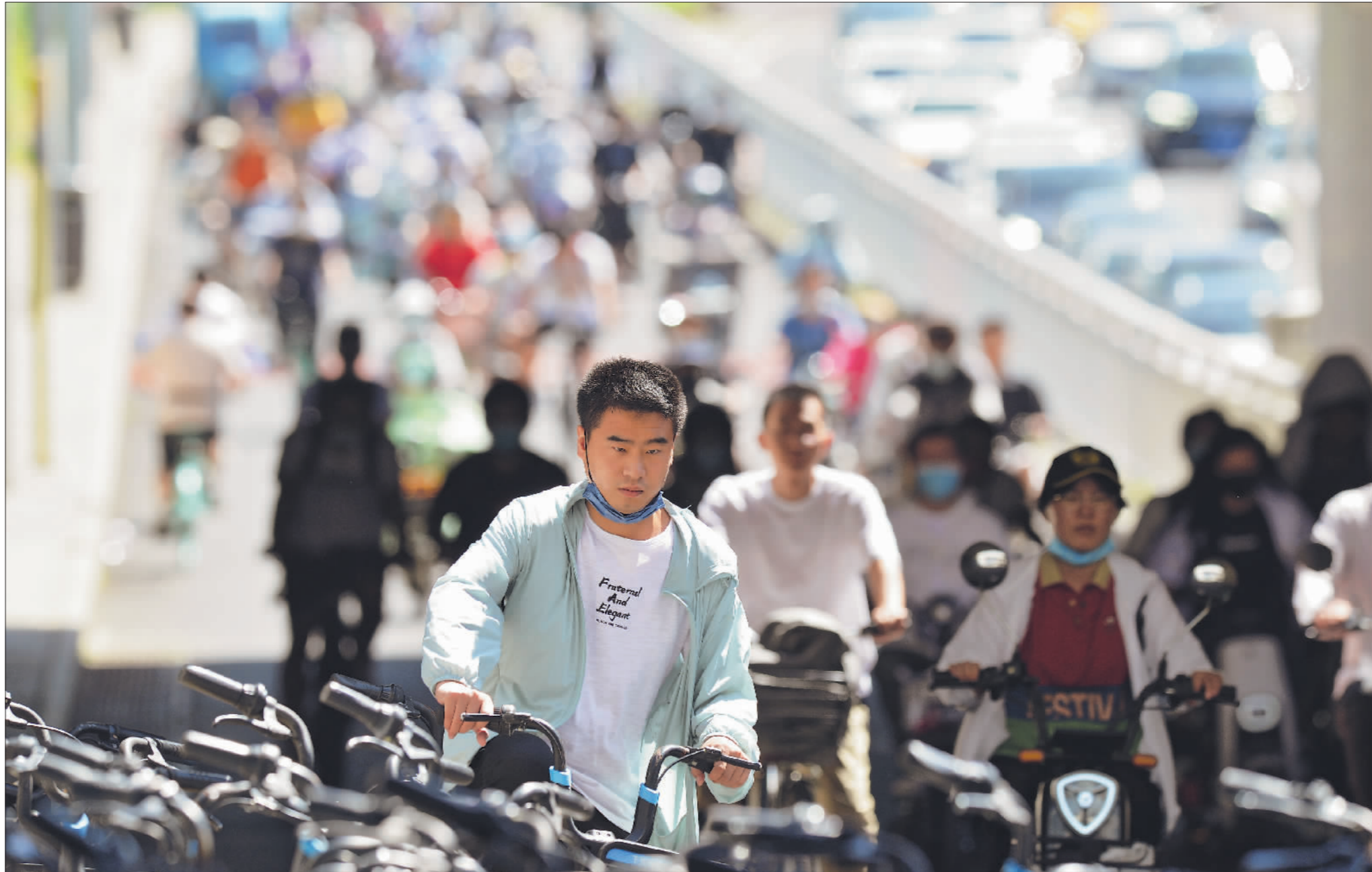
→7月7日上午,正值早高峰时段,骑上班族的市民们在北京西二旗桥下。这里距离北京首条自行车专用道出口仅100多米,是很多骑行上班族的必经之地。