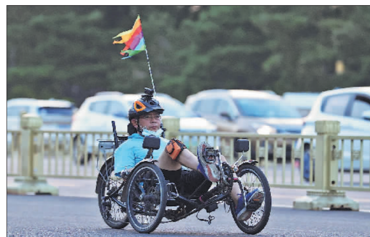
↑7月7日晚,骑行爱好者在长安街上骑行。