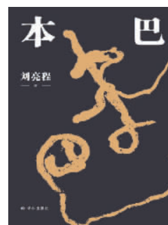
《本巴》 刘亮程著 译林出版社