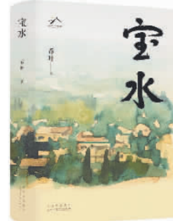
《宝水》 乔叶著 北京十月文艺出版社