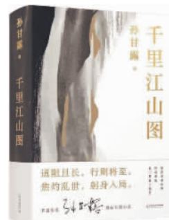
《千里江山图》 孙甘露著 上海文艺出版社