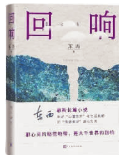
《回响》 东西著 人民文学出版社

杨志军1955年出生于青海,父母都是扎根高原的知识分子。他深情回望父亲母亲与几代草原建设者的艰辛探索足迹,书写高海拔地区的时代巨变与草原牧人的精神心路。《雪山大地》将青海藏族牧区几十年来在党和政府领导下发生的改天换地,当地藏汉民众生产生活方式、身份地位及价值观的沧桑巨变,以“父亲母亲”为代表的三代人在这片土地上耕耘建设的日日夜夜展现在读者面前,同时体现了民族团结进步、铸牢中华民族共同体意识的思想与价值追求。