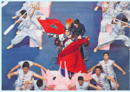
9月23日晚,杭州亚运会开幕式前的暖场演出,极具浙江风韵的本土戏曲演出赢得阵阵喝彩。