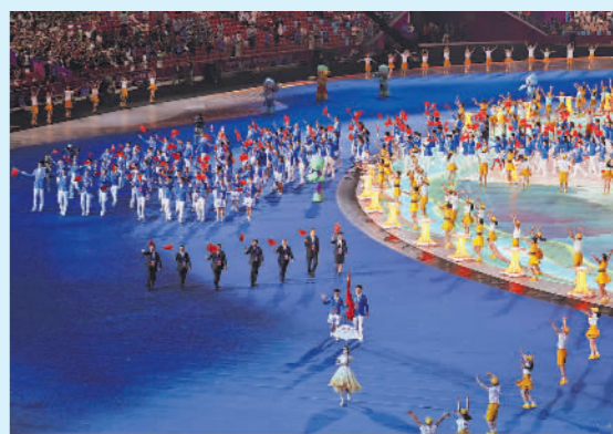
9月23日晚,杭州亚运会开幕式现场,中国代表团在全场观众的欢呼声中入场。