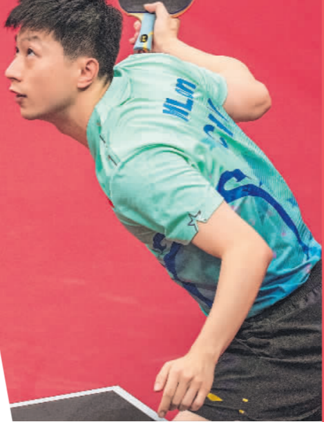
9月22日,中国队选手马龙在比赛中发球。在男子团体小组赛A组比赛中,中国队以3比0战胜越南队。当日,杭州亚运会乒乓球男子团体小组赛在杭州拱墅运河体育公园体育馆进行。