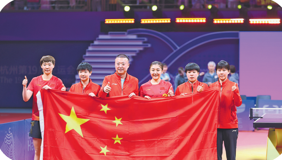
9月26日,中国队获得杭州亚运会乒乓球女子团体金牌。