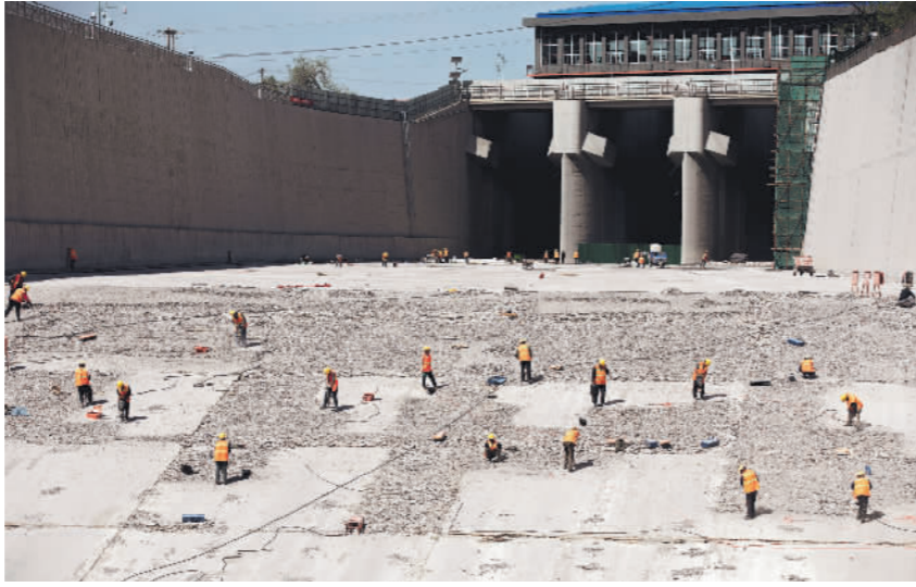
4月17日,施工人员为官厅水库溢洪道泄槽底板进行除险加固作业。