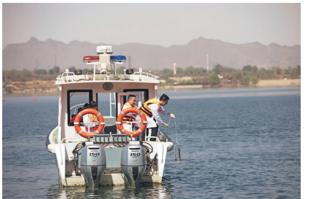
↑4月17日,北京市官厅水库管理处水环境监测分中心化验员正乘船采集水库水样。