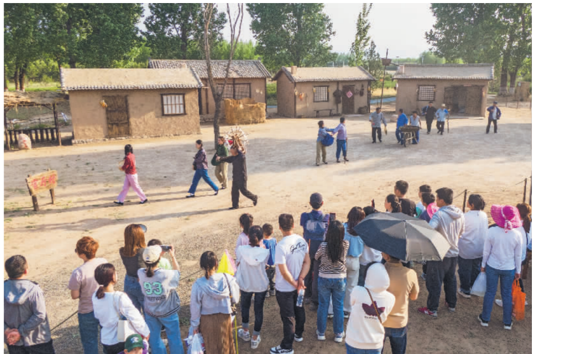
↓5月2日,河北省怀来县官厅水库国家湿地公园内,当地村民和专业演员共同出演《官厅水库移民》实景剧。该剧讲述了老怀来城百姓为建设官厅水库而全城搬迁的感人故事。