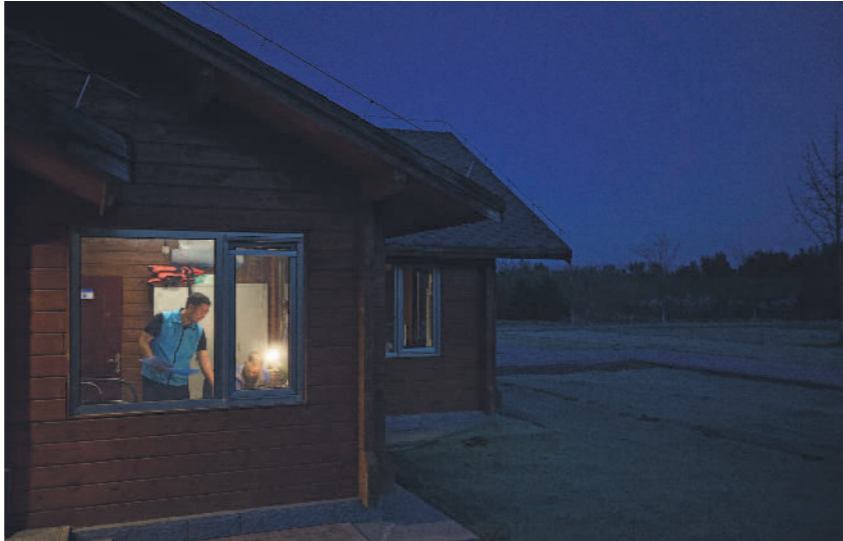
4月16日晚,在官厅水库八号桥水质净化湿地,北京市官厅水库管理处永定河库岸管理所的工作人员正在查看当天的巡视记录。