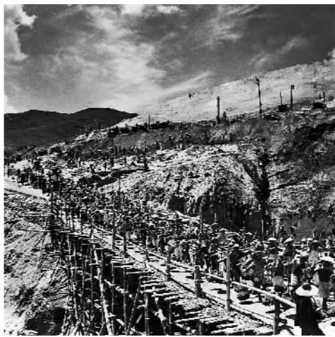
1953年,数千名来自全国各地的工人参加官厅水库的修建。