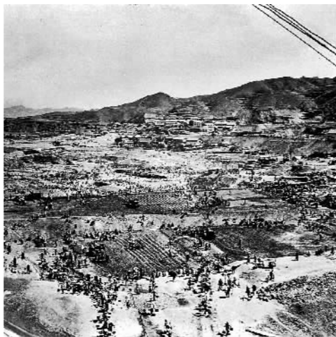
1953年,官厅水库拦河坝进行填筑坝身作业。