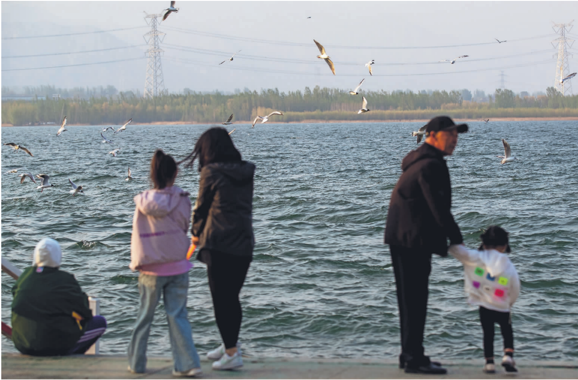
↑4月21日,河北省怀来县,游人正在官厅水库附近的空地上欣赏燕鸥。随着官厅水库周边生态的修复,这里的生物多样性进一步丰富,每年都会有不少候鸟到此停留觅食。