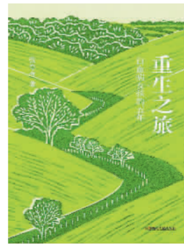
《重生之旅》张夸夸著 湖南文艺出版社

每个人头顶都有一片天,都会有雨水的滋润。禾苗只要长在泥土里,就会被雨水滋养。人要找到自己的土壤,才能活出生命本来的样子。作者用清新活泼的文字和灵动自然的素描,记录了泥土和时光,在忙碌的日子里,在细小事里得到内心的安宁,收获生命的力量。作者以朴素、敬畏、清明的人生态度,带我们重新打量我们身处的这个纷杂世界,找回自己的初心和童心,找回生命最初的感动和生活本身的意义。