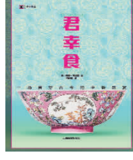
《君幸食》[英]狄龙·邓洛普著 何雨珈译 上海译文出版社

汉时北道,平凉之后,北出萧关,因出萧关,北道又称“萧关道”。作者重走萧关道,途经西北的山川城镇、原野村店,记录下路途中的见闻与偶遇之人,寻探此路上故人的踪迹。过去和未来交织于一处,古人与今人的命运自成对照。这是探访古路的游记,也是一窥历史洪流下普通人命运的人口。这些走过同样路线的前人来自不同时代,作者把他们邀请到自己的旅行中,让他们各自展示自己的所见所闻,从而让萧关道之行变得凝重丰富,有了不同寻常的时间深度。