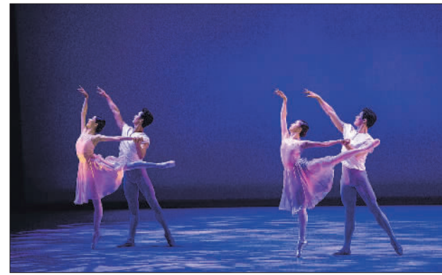
中央芭蕾舞团在美上演芭蕾《叙事曲》

韩国行政安全部22日将济州岛、全罗南道、庆尚南道等地区的暴雨警报级别从“关注”提升至“注意”,同时要求有关部门及时做好事先管理及疏散引导工作。