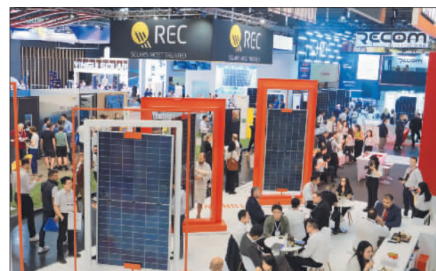
德国慕尼黑举行2024年欧洲国际太阳能展

土耳其跆拳道运动员穆罕默德·波拉特在演出结束后对记者说,精彩的表演仿佛把他带回到去年在成都世界大学生夏季运动会开幕式。《只此青绿》的演员们行云流水般的舞姿,把诗剧演绎得精彩绝伦。