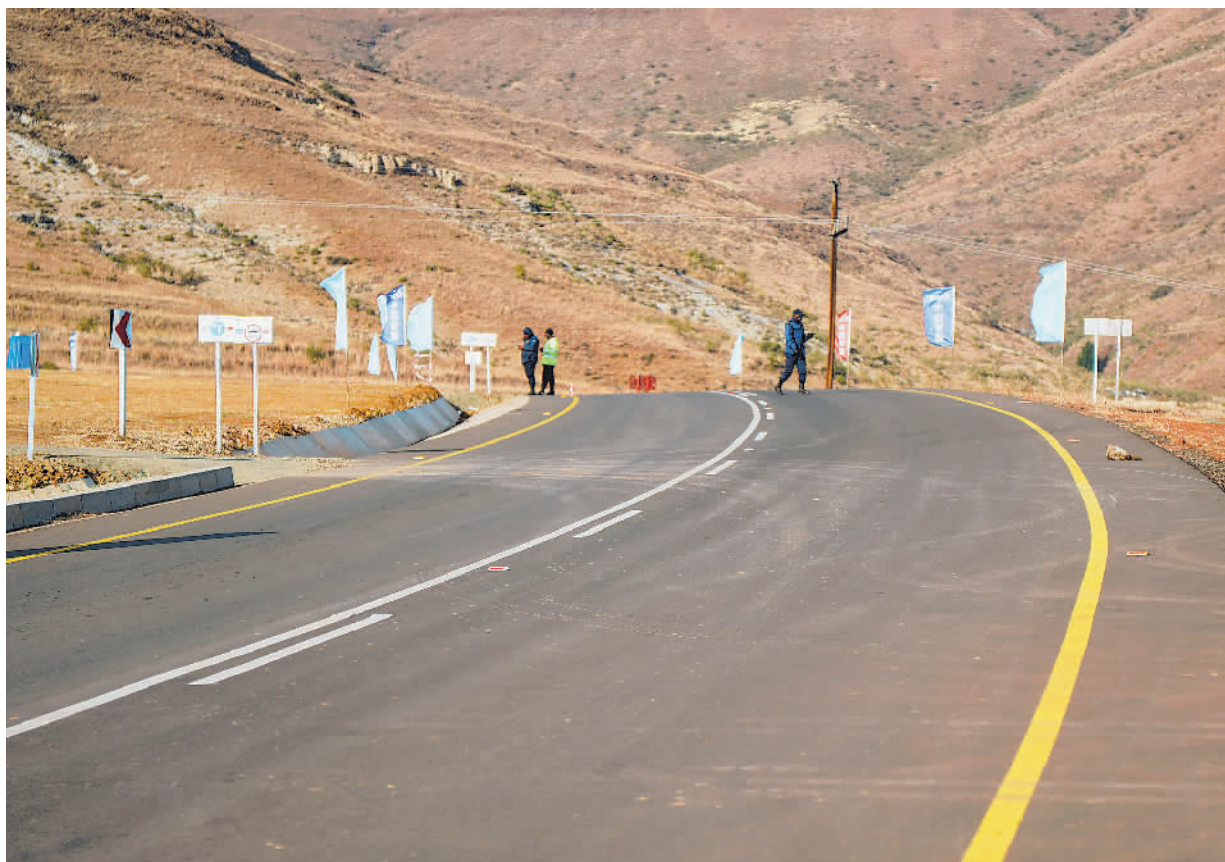
▲这是近日拍摄的莱索托莫塞公路。