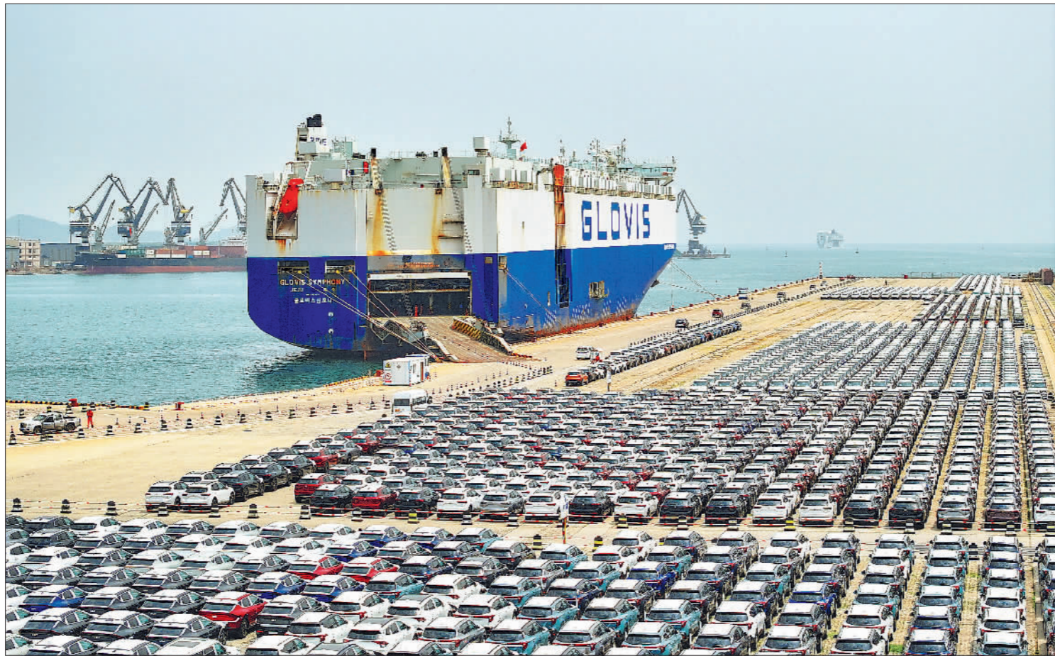
山东港口烟台港前5个月商品车运量同比增长三成

“未来,我们应更多地依靠科技力量去实现‘无感化’的客流监测引导。”周永博认为,客流管理工作应该前移,旅游目的地可以通过提前发布客流预测帮助人们形成理性判断,防止游客过度集中于局部热点区域,并尝试在一些传统热点区域建立主题游径,引导客流向其他新兴文化旅游空间扩散,形成全局联动的旅游目的地发展态势。