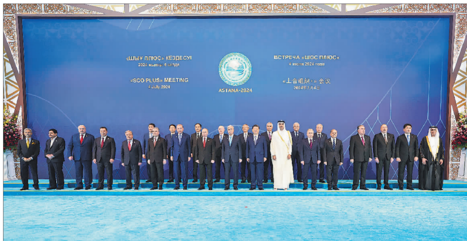
当地时间7月4日下午,国家主席习近平在阿斯塔纳出席“上海合作组织+”阿斯塔纳峰会并发表题为《携手构建更加美好的上海合作组织家园》的重要讲话。峰会开始前,习近平出席托卡耶夫为与会代表团长举行的欢迎宴会并集体合影。

新华社阿斯塔纳7月4日电 (记者孙浩 黄河 张继业)当地时间7月4日下午,国家主席习近平在阿斯塔纳出席“上海合作组织+”阿斯塔纳峰会并发表题为《携手构建更加美好的上海合作组织家园》的重要讲话。 习近平指出,我们首次以“上海合作组织+”的形式举行峰会,好朋友、新伙伴济济一堂、共商大计,说明在新的时代条件下本组织理念广受欢迎,成员国的朋友遍布天下。 当前,世界之变、时代之变、历史之变正以前所未有的方式展开。人类文明在大步前进的同时,不安全、不稳定、不确定因素也明显增加。应对好这一变局,关键要有识变之智、应变之方、求变之勇。我们要牢固树立命运共同体意识,始终秉持“上海精神”,坚定不移走契合本国国情、符合本地区实际的发展道路,共同建设更加美好的上海合作组织家园,让各国人民安居、乐业、幸福。 习近平提出五点建议。 第一,建设团结互信的共同家园。“上海精神”同和平共处五项原则一脉相承,是本组织的共同价值,应该倍加珍惜、始终遵循。我们要尊重彼此自主选择的发展道路,支持彼此维护核心利益,通过战略沟通消弭分歧、凝聚共识、增进互信。中方建议成员国加强治国理政经验交流,适时举办上海合作组织政党论坛。