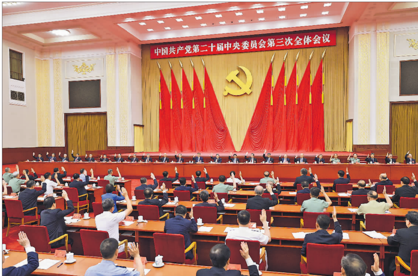
中国共产党第二十届中央委员会第三次全体会议,于2024年7月15日至18日在北京举行。中央政治局主持会议。