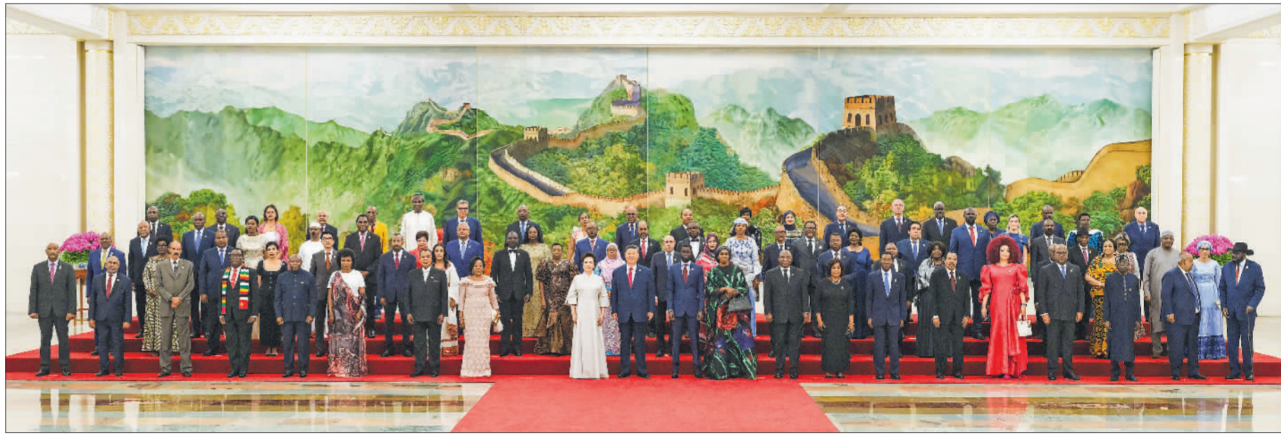
9月4日晚，国家主席习近平和夫人彭丽媛在北京人民大会堂举行宴会，欢迎来华出席中非合作论坛北京峰会的非方及国际贵宾。这是宴会前，习近平和彭丽媛同贵宾们集体合影留念。