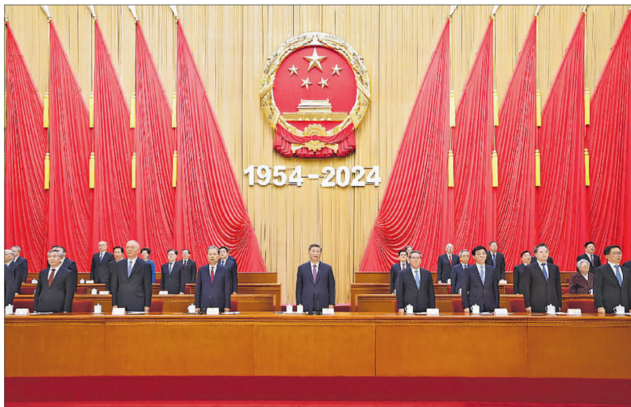
9月14日上午，中共中央、全国人大常委会在北京人民大会堂隆重举行庆祝全国人民代表大会成立70周年大会。习近平、李强、赵乐际、王沪宁、蔡奇、丁薛祥、李希、韩正等出席大会。

新华社北京9月14日电 中共中央、全国人大常委会14日上午在人民大会堂隆重举行庆祝全国人民代表大会成立70周年大会。中共中央总书记、国家主席、中央军委主席习近平出席会议并发表重要讲话。他强调，要进一步坚定道路自信、理论自信、制度自信、文化自信，发展全过程人民民主，坚持好、完善好、运行好人民代表大会制度，为实现新时代新征程党和人民的奋斗目标提供坚实制度保障。