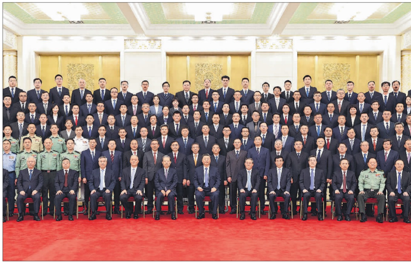
9月23日，党和国家领导人习近平、李强、赵乐际、王沪宁、蔡奇、丁薛祥、李希等在人民大会堂会见探月工程嫦娥六号任务参研参试人员代表并参观月球样品和探月工程成果展览。这是习近平等会见探月工程嫦娥六号任务参研参试人员代表。