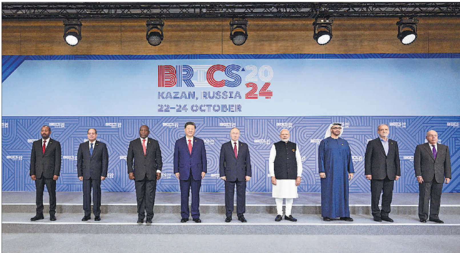
当地时间10月23日上午，金砖国家领导人第十六次会晤在喀山会展中心举行。俄罗斯总统普京主持会晤。中国国家主席习近平、巴西总统卢拉（线上）、埃及总统塞西、埃塞俄比亚总理阿比、印度总理莫迪、伊朗总统佩泽希齐扬、南非总统拉马福萨、阿联酋总统穆罕默德等出席。这是会晤期间，金砖国家领导人集体合影。

新华社俄罗斯喀山10月23日电（记者倪四义 胡晓光）当地时间10月23日上午，金砖国家领导人第十六次会晤在喀山会展中心举行。俄罗斯总统普京主持会晤。中国国家主席习近平、巴西总统卢拉（线上）、埃及总统塞西、埃塞俄比亚总理阿比、印度总理莫迪、伊朗总统佩泽希齐扬、南非总统拉马福萨、阿联酋总统穆罕默德等出席。 习近平首先出席小范围会议。 习近平欢迎新成员加入金砖大家庭以及邀请多个国家成为金砖伙伴国。习