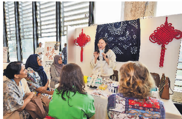
国际人士在瑞士日内瓦万国宫体验中医诊疗

近日,由中国国家中医药管理局、中国常驻日内瓦代表团、联合国日内瓦办事处共同主办的“中医药走进万国宫”活动顺利举行。来自巴西、巴基斯坦、等50余国常驻日内瓦代表、高级外交官以及国际组织官员等约200人参加。图为在瑞士日内瓦举办的“中医药走进万国宫”活动中,人们听取针灸介绍。