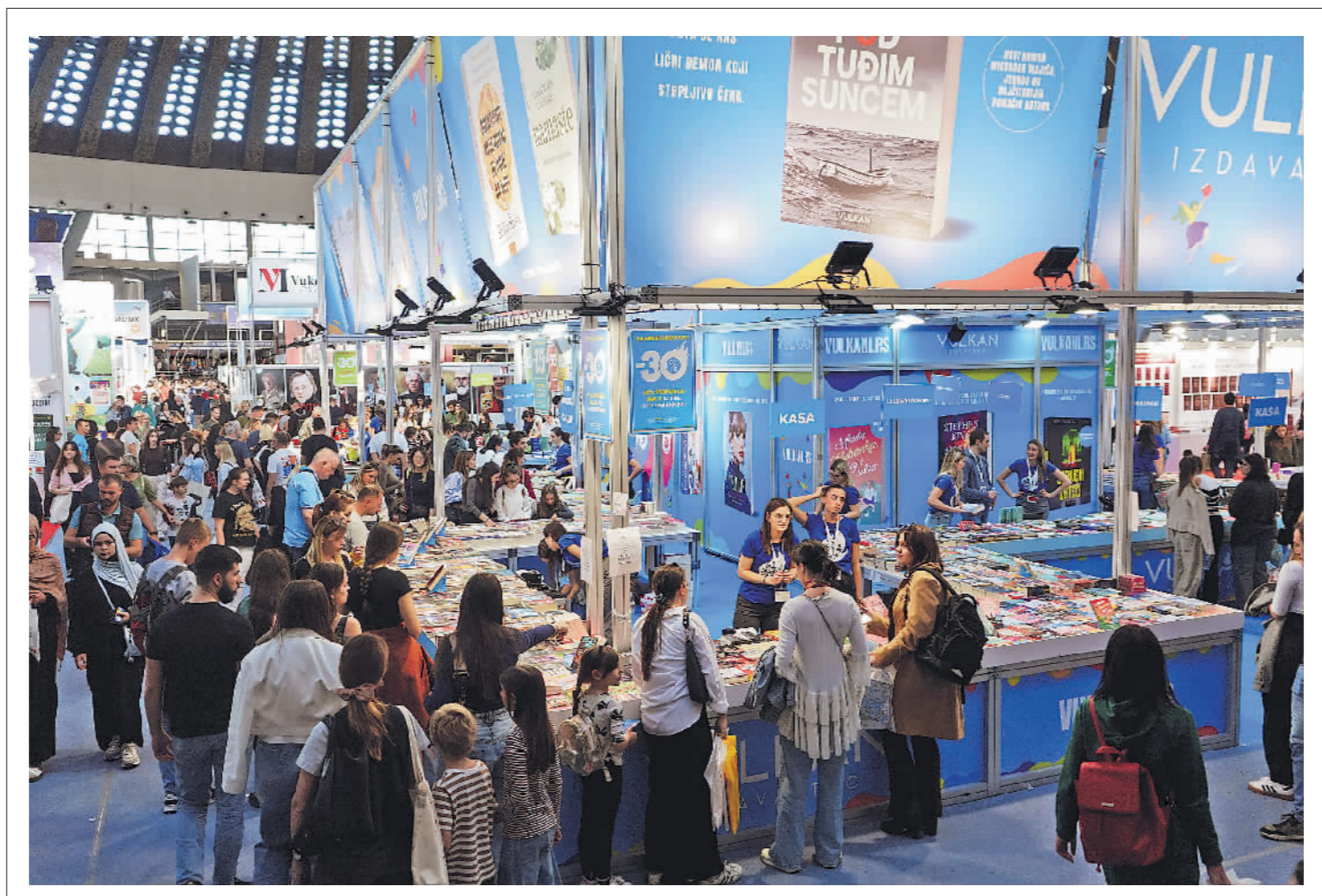
塞尔维亚书展上的“中国图书热”

世界自然保护联盟近日更新其濒危物种红色名录,显示全球超过三分之一的树种濒临灭绝。造成树种减少的因素包括气候变化、人类砍伐、采矿修路等活动。濒危物种较多的国家包括斐济、古巴和马达加斯加。世界自然保护联盟总干事格蕾特·阿吉拉尔说,从更新后的濒危物种红色名录可以看出,树种减少“对数以千计其他物种构成直接威胁,涉及植物、真菌和动物”。(莫菲菲 辑)