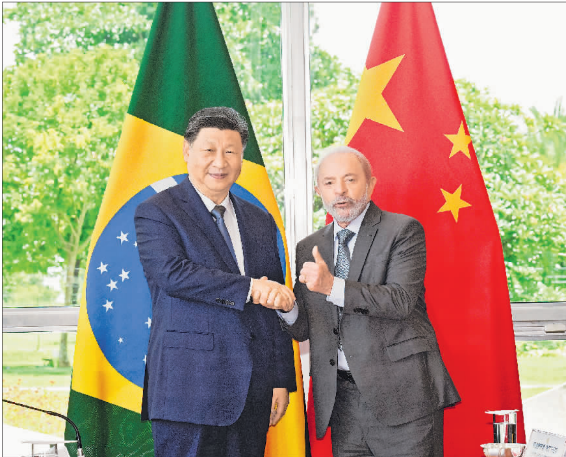
当地时间11月20日上午,国家主席习近平在巴西利亚总统官邸黎明宫同巴西总统卢拉举行会谈。