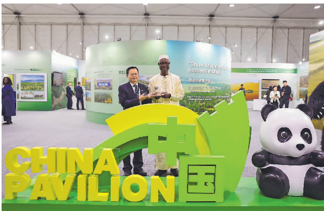
▲近日,易卜拉欣·蒂奥(右)为中方颁发“联合国防治荒漠化公约30周年”纪念牌。