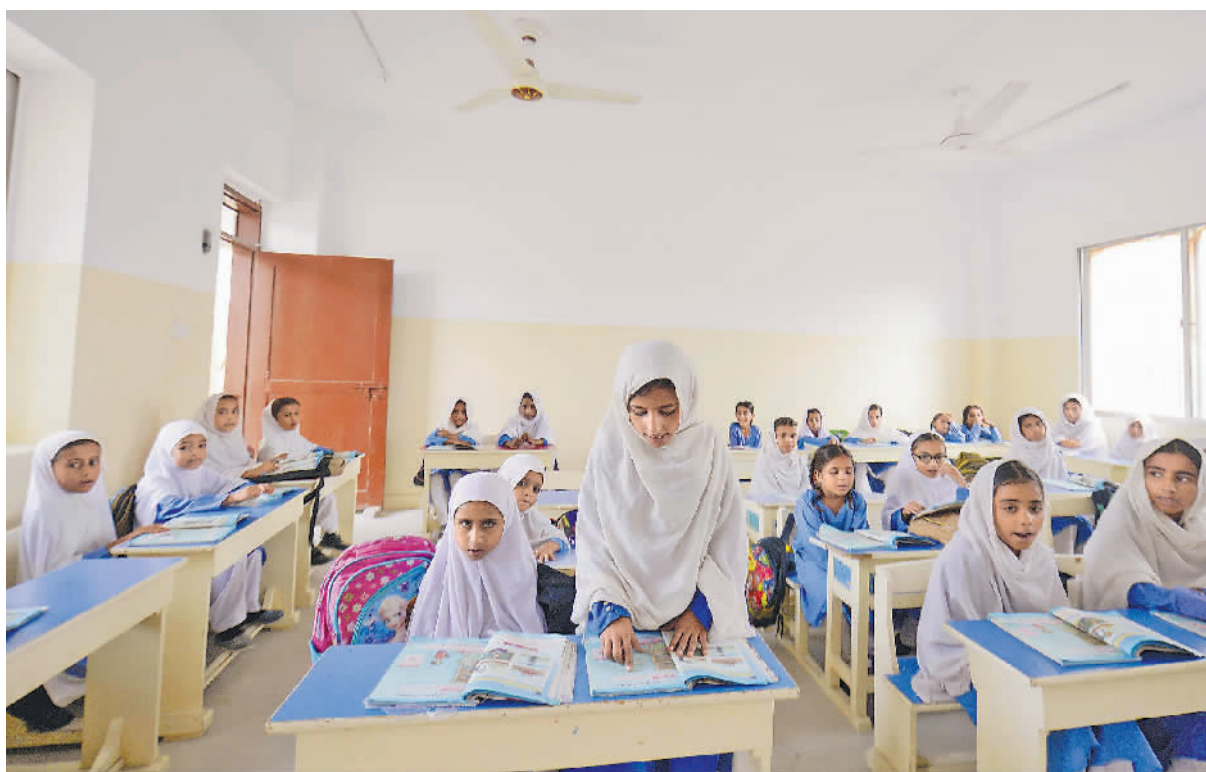
▲图为近日在巴基斯坦瓜达尔的中巴瓜达尔地区法曲尔公立学校,当地学生正在上课。