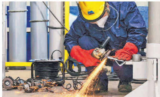
11月21日,2024年河南省机械冶金建材行业职工技能竞赛电焊工决赛在郑州举行。