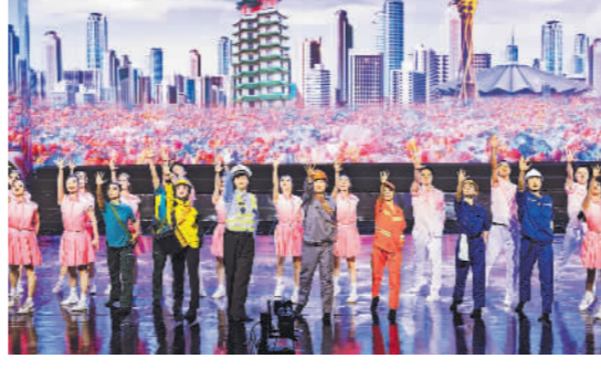
5月1日,河南省总工会致敬劳动者“五一”特别节目隆重上演,直播观看量突破90万。