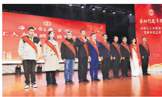
12月20日,河南省“中国工人大思政课”首场示范活动举行。

一次次技能培训汇聚星火成炬,一场场劳动和技能竞赛火热上演,带动一大批产业工人追求逐梦、建功立业。河南省总工会组织参加首届全国“红旗杯”班组长大赛,全省4.2万人报名参赛,获优秀组织单位;开展“四技五小两比”等群众性创新活动,各级工会申报全国职工“五小”创新成果项目1023个;洛阳市总工会通过“网上赛+邀请赛+模拟赛+区域赛+对抗赛”五