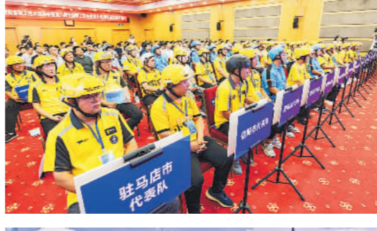
7月26日,第七届河南省职工技术运动会开幕,共设置网约配送员、人工智能训练师等6个通用工种。