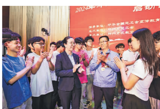
4月12日,“劳模工匠进校园”全国示范性活动、郑州市2024年“劳模工匠进校园”活动启动仪式暨首场示范宣讲举行。