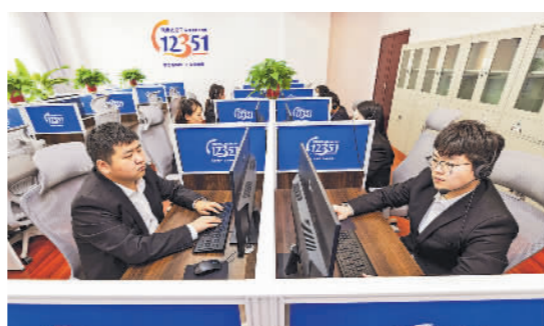
12351河南省总工会服务职工热线话务室。