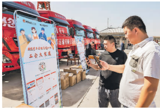
4月23日,河南省货车司机入会和服务工作推进活动在鹤壁举办。