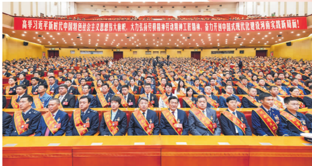
4月30日,河南省表彰劳动模范和先进工作者大会隆重召开。

翻阅河南省总工会2024年“成绩单”,一项项有力举措、一件件暖心实事背后,是河南省总工会用心用情用力当好职工群众知心人、贴心人和“娘家人”的坚定承诺,也彰显着全省各级工会做强做优“工”字品牌、在新时代担当作为的坚定决心和显著成果。