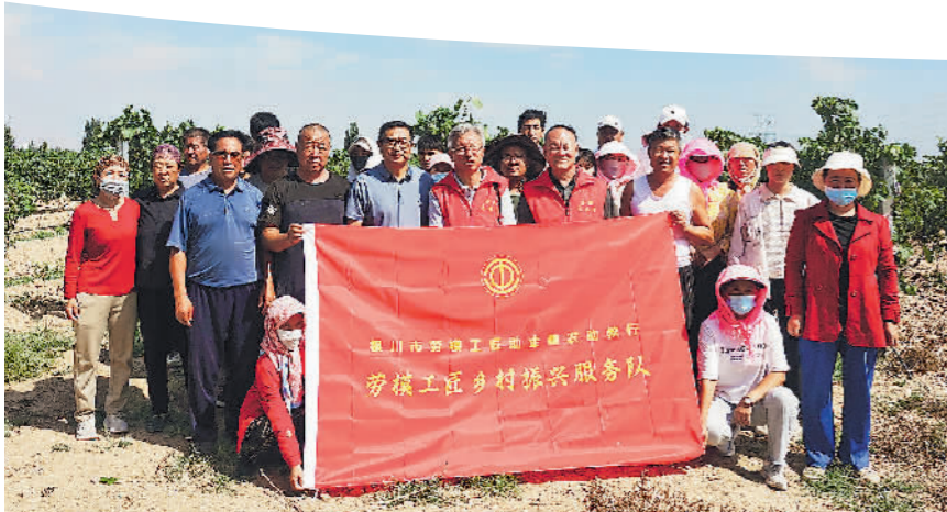
银川市劳模工匠助企助农助教劳模工匠乡村振兴服务队集体合影。