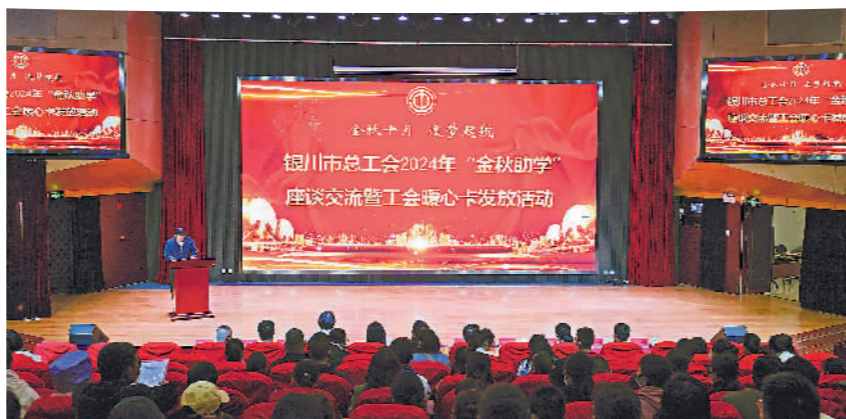
银川市总工会2024年“金秋助学”座谈交流暨工会暖心卡发放活动举办。