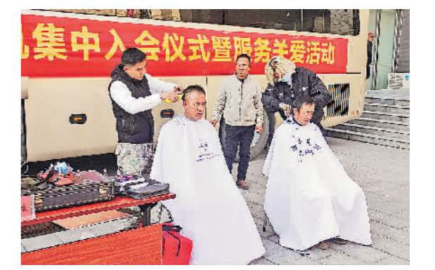
宁夏贺拉拉货车司机集中入会仪式暨服务关爱活动。