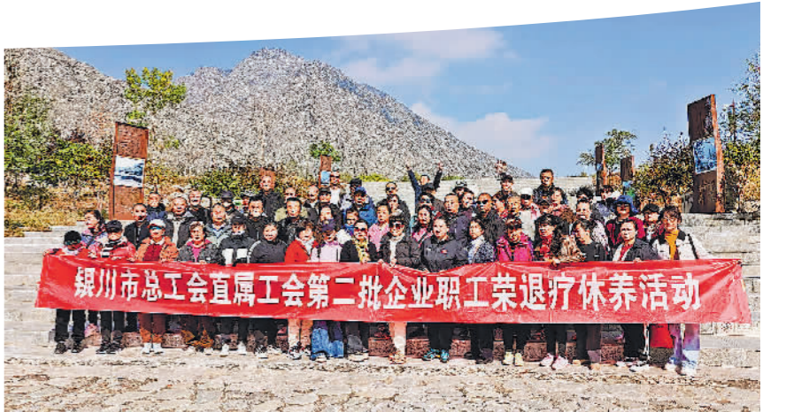
银川市总工会直属工会举办第二批企业职工荣退疗休养活动。