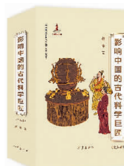
《影响中国的古代科学巨匠》 葛冰著 须臾绘 作家出版社

“写作变革的大方向应该是道德勇气的确立和理想信念的重铸,写作的最终成果是创造人格、更新生命。有必要重申,人格仍然是最重要的写作力量。”