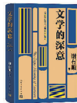
《文学的深意》 谢有顺著 人民文学出版社

“写作变革的大方向应该是道德勇气的确立和理想信念的重铸,写作的最终成果是创造人格、更新生命。有必要重申,人格仍然是最重要的写作力量。”