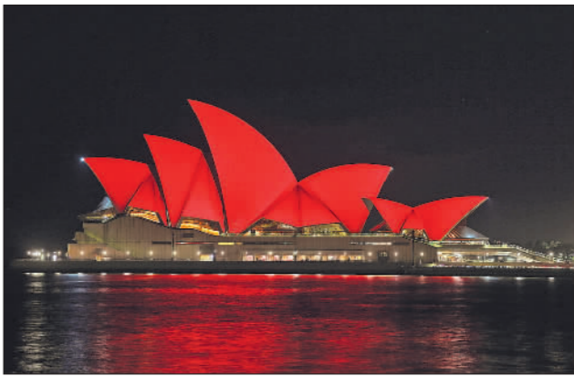
悉尼歌剧院点亮“中国红” 当地时间2月4日,澳大利亚悉尼歌剧院点亮“中国红”,庆祝中国农历新年。