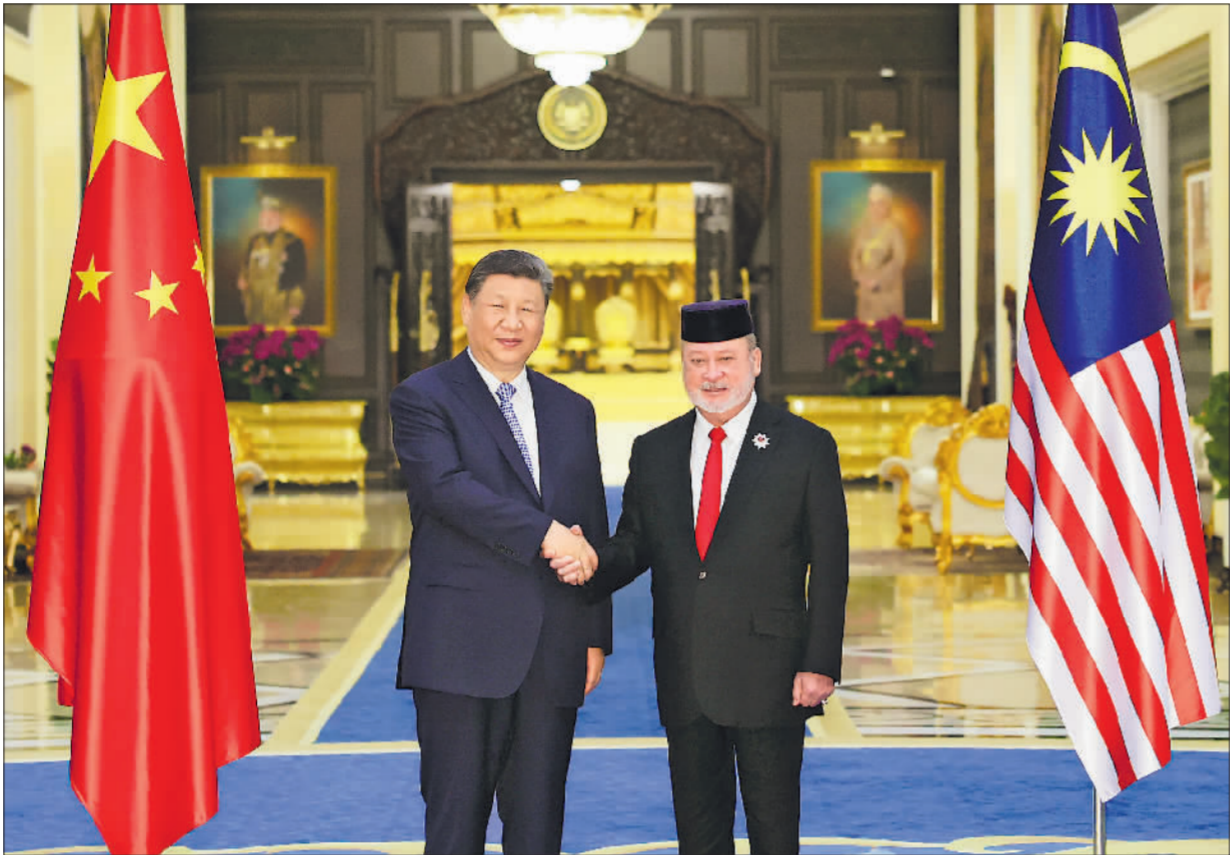
4月16日上午,马来西亚最高元首易卜拉欣在马来西亚国家王宫同中国国家主席习近平举行会见。

新华社吉隆坡4月16日电 (记者杨依军 孙浩)4月16日上午,马来西亚最高元首易卜拉欣在马来西亚国家王宫同中国国家主席习近平举行会见。 4月的吉隆坡,阳光明媚,草木葱茏。 易卜拉欣在国家王宫广场为习近平举行隆重欢迎仪式。