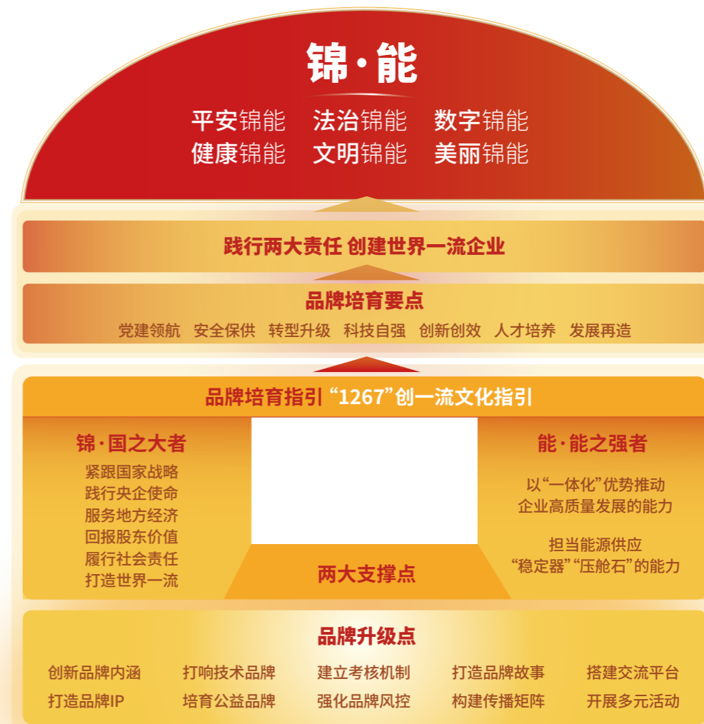
“锦·能”特色子品牌培育思路模型

国能锦界公司将成立二十年来形成的优秀基因为灵感来源，始终传承和弘扬“延安精神”和“南泥湾精神”，为品牌建设提供了深刻的文化支撑，以“锦”为精神内核，以“能”为发展动力，打造“锦·能”特色子品牌，将极具地方特色的窑洞作为品牌培育模型，不断丰富品牌内涵，将国能锦界公司自身优势与国家能源集团品牌卓越行动相结合，总结凝练了“聚焦一个主题、践行两大责任、紧扣六条主线、做实七大工程”的“1267”创一流文化指引，通过落实集团RISE品牌战略，结合品牌五项工程建设，为集团公司塑造“全球可持续能源典范”品牌形象贡献力量。