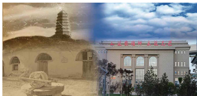
“一个项目一座城，搬出窑洞进了城”

国能锦界能源有限责任公司（对外简称国能锦界公司）经过二十年的发展，传承于红色的基因血脉，扎根于灵魂的信仰根系，培育出“锦能人”对党和人民坚不可摧的忠诚和赤诚。国能锦界公司时刻坚持“延安精神”和“南泥湾精神”实事求是、理论联系实际、全心全意为人民服务的精神和自力更生艰苦奋斗的光荣传统和优良作风，发扬建设时期“一把镢头一杆枪”的工作作风，创造了“项目引领园区盛，煤电联营展新姿”的扎实成效。