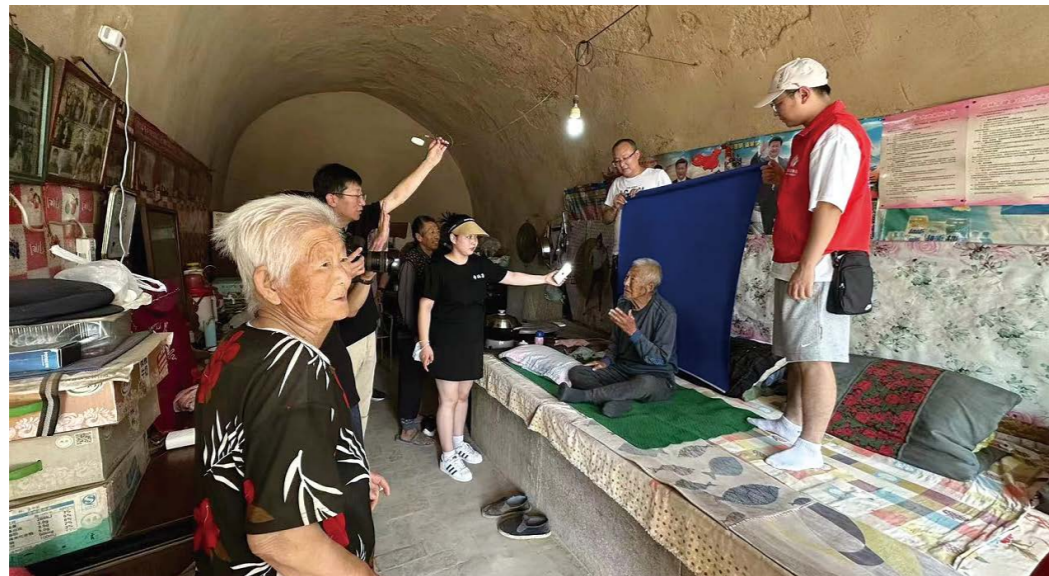
“春日·暖阳”公益行动 定格最美瞬间

持续推进“春日·暖阳”公益行动，“让暖心之花，一路绽放”在光明网、环球网等多家媒体报道，展示了国能锦界公司在公益事业领域内的目标、使命和价值观念。